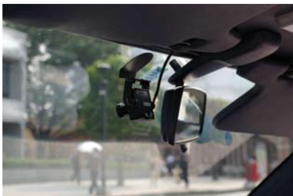
小型カメラで前方の画像を記録するドライブレコーダー。政府も普及に力を入れている

単価は5万円前後ですが、装置の効用についてエンドユーザーの認知が進んでおらず、お客様にしっかりした説明ができないと売れません。お客様と相対で売る商材は、整備事業者の皆さんが得意とする分野のほうです。景気が停滞しているときは、余分な支出を抑えることが鉄則です。数台の事業用車両を抱える事業者ユーザーには、交通事故防止のために、ぜひ勧めたい装置です。また、狭い生活道路を走行する機会が多いユーザーにも、自己防衛のために必要になるかもしれません。