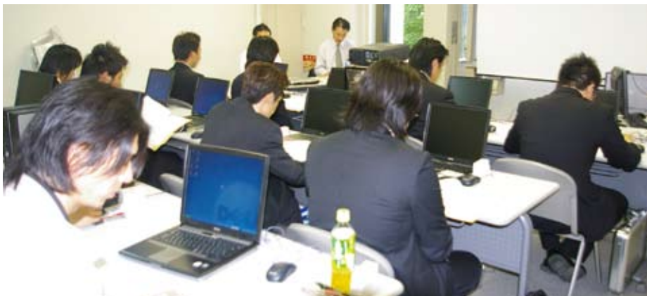
JAPRA加盟各社のフロントマンが参加、売上向上につなげようと真剣な取り組みとなった

NGP協同組合は、5月10、11日の2日間、NGPシステム導入を希望するJAPRA(日本自動車リサイクル部品販売団体協議会)加盟の事業者を対象に、講習会を東京・品川の協同組合本部で実施しました。講習会には、JAPRA加盟12社12人が参加し、NGP協同組合が初級フロントマン研修で使用しているテキストを使用して、システム運