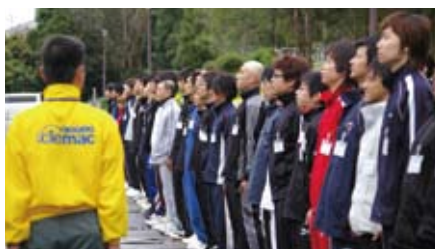
体験するのは初めてという人が多い団体訓練。苦しさ乗り越えて、一回り、人間が成長できる

NGP協同組合は4月18～21日まで3泊4日の日程で、東京・新木場のBumB東京スポーツ文化館を会場に第16回基礎研修会を実施しました。新入社員を対象にNGPマンとしての精神鍛錬と社会人としてのモラル徹底を目的にした基礎研修会に全国の組合員から95人が参加、集団生活を行いながらNGPマンの基本的精神を学びました。