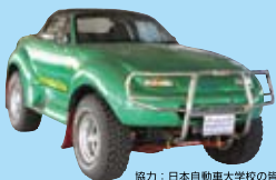
協力：日本自動車大学の皆さん