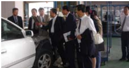
マルトシ青木の工場を視察する中国からの調査団

中国・寧夏回族自治区自動車リサイクル調査団が、5月8～11日まで日本を訪れ、NGP協同組合関連の事業所を視察しました。寧夏