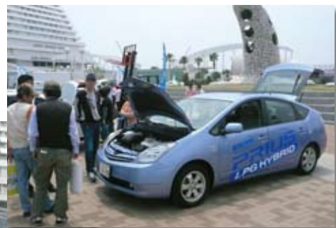
温暖化対策の先端技術が、エコカーワールドで勢ぞろい。今、乗っている自動車は「エコ整備」で環境負荷低減を!