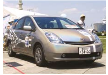
トヨタが開発を進めてきたプリウスのプラグインハイブリッド（09年のエコカーワールドで）

電池の高性能化は電気自動車、EV化が進むハイブリッド車にとって重要課題です。トヨタ自動車は「プリウス」をベースにしたプラグインハイブリッドを登場させます。そのとき、電池はニッケル水素からリチウムイオンに変わります。今回は電池の問題を追ってみました。