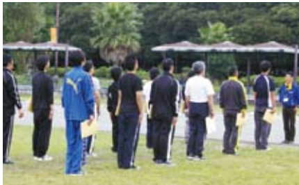
挨拶、暗記の基本訓練。初心を忘れないことは大切だ