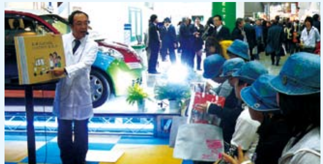
今年も博士が登場して紙芝居で自動車のリサイクルとリサイクル部品をPR (写真は昨年エコプロダクツ NGPブース)

の理解を深めてもらおうと、配布するパンフレットも分かりやすいように変えました。昨年はブースにリサイクル博士が登場し、紙芝居で自動車リサイクルがどのように行われ、どのようにリサイクル部品が作られるかを子供たちに伝えました。好評に応じて今年も博士が登場する予定で、自動車関連の出展コーナーで来場者の皆様を楽しめるNGPブースを演出します。