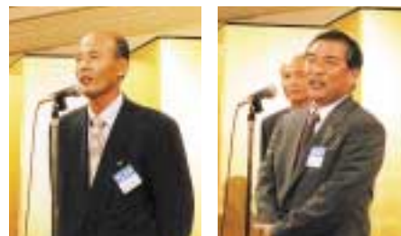
大会の中では、新しくNGPメンバーに加わったメンバーの紹介と挨拶も行われた。