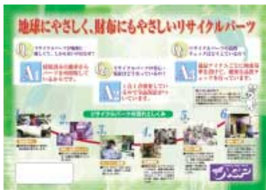
リサイクル部品説明用パネルツール(表)