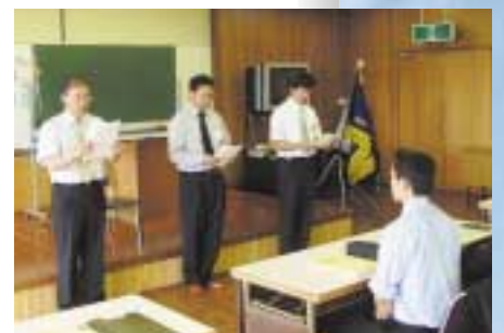
研修最終日には各社の代表が決意表明