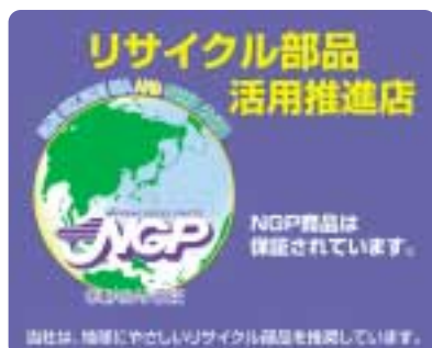
リサイクル部品活用推進店ステッカー

NGPグループでは、一般ユーザーにもっと自動車リサイクル部品のことを知ってもらい、活用促進につなげていくため、リサイクル部品について、目で見て分かりやすく、簡単に説明ができる啓蒙ツールを作成しています。NGPグループ商品を取り扱っている「リサイクル部品活用推進店」の自動車整備工場、板金工場などに無料配布して、PR活動を展開しています。