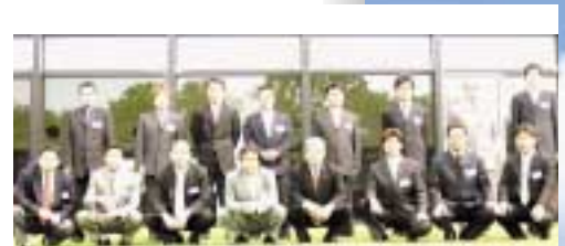
初期指導に参加した受講生と講師全員で記念撮影

3日間の研修最終日は、研修に参加した各社の代表による決意表明が行われ、NGPグループは心強い新しい仲間を迎えた。