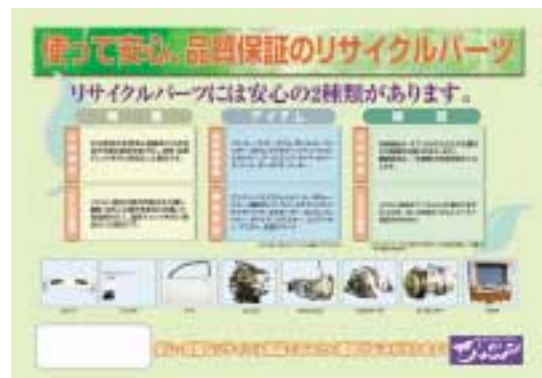
リサイクル部品説明用パネルツール(裏)

リサイクル部品活用促進啓蒙ツールは上記の3つのアイテムをセットにして、NGPグループメンバーから整備工場様へ無料配布いたしております。(お問い合わせは、お取引のあるNGPグループメンバーまでお願いいたします。)