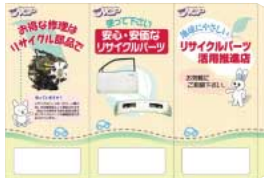
卓上三角スタンド